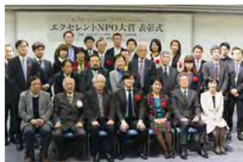
※第5回表彰式風景写真

応募受付・審査進行管理:「エクセレントNPO」をめざそう市民会議事務局 〒104-0043 東京都中央区湊1丁目1番12号 HSB鐵砲洲4階 言論NPO内 Tel. 03-6262-8772(平日9時30分～17時30分受付) Fax. 03-6262-8773(24時間受付) お問い合わせ用メールアドレス(enpo@genron-npo.net)